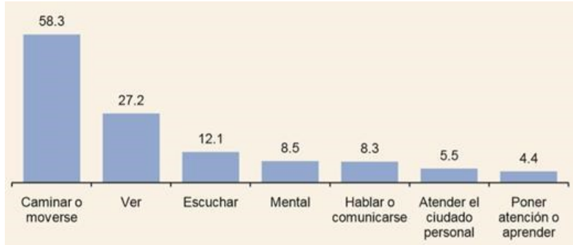
Grafica 1 Porcentaje de población con discapacidad por tipo de discapacidad.

En dicha clasificación la segunda dificultad más frecuente a nivel nacional, es la dificultad para ver con un 27.2%. Por lo que representa un número considerable de ciudadanos que con dificultad acceden a los mensajes visuales que emiten el cine y la televisión.